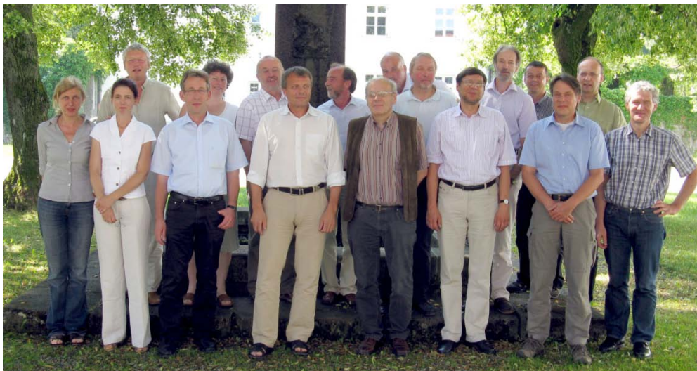
Der AK „Nachhaltige Nährstoffhaushalte“ mit Gastreferenten; Sitzung in Grub am 1./2. Juli 2010.